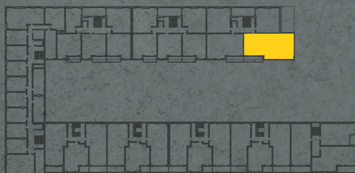
umístění bytu na 2. np