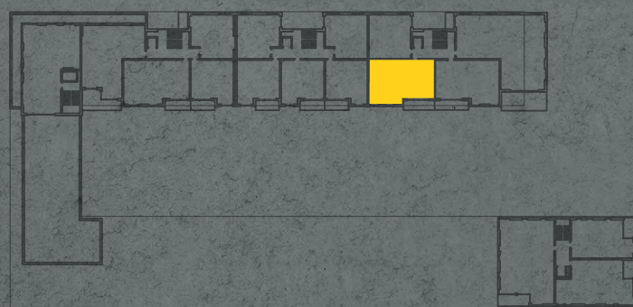
umístění bytu na 4. np