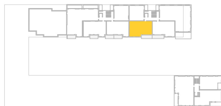
umístění bytu na 5. np