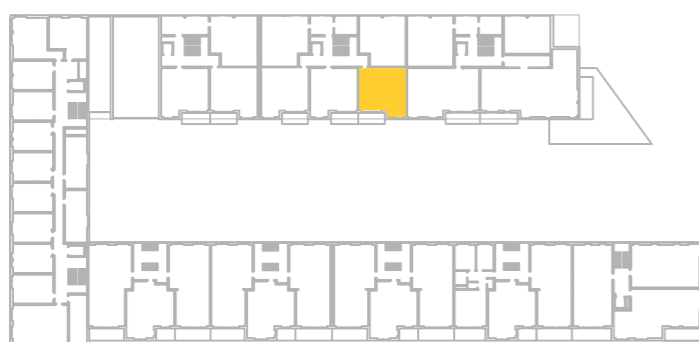
umístění bytu na 1. np