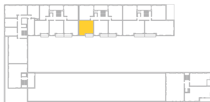
umístění bytu na 3. np