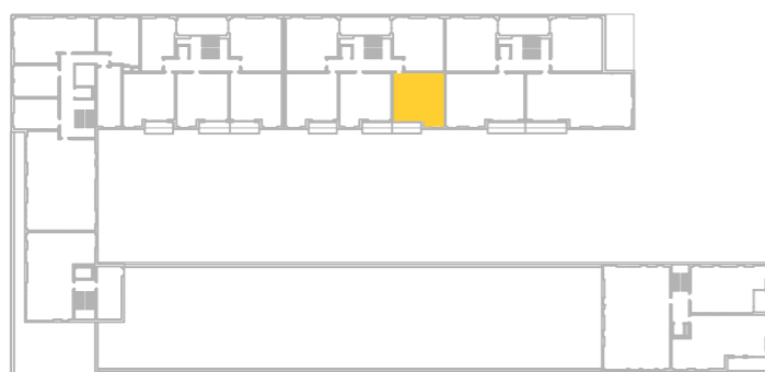
umístění bytu na 3. np