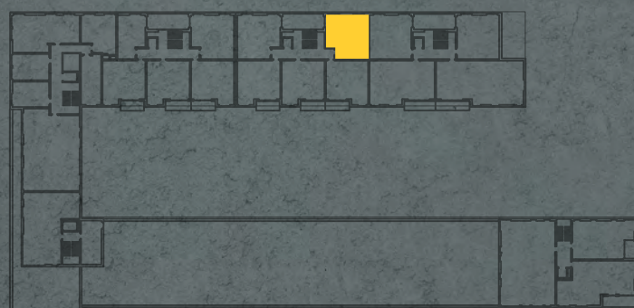
umístění bytu na 3. np