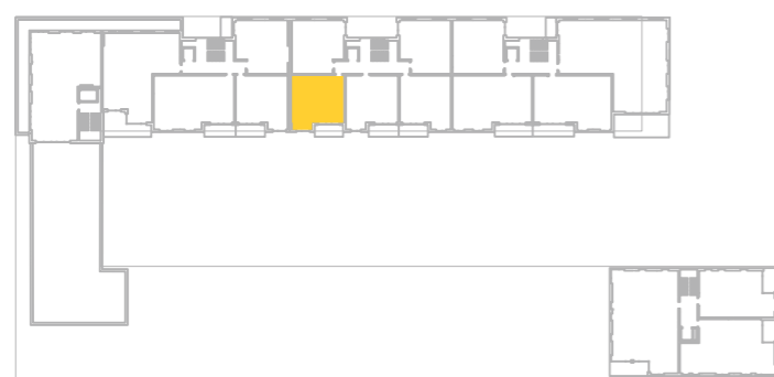
umístění bytu na 4. np