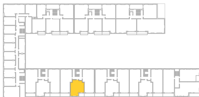
umístění bytu na 2. np