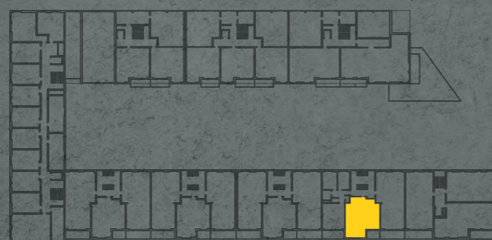
umístění bytu na 1. np