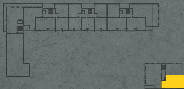
umístění bytu na 4. np