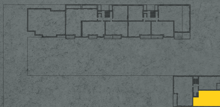
umístění bytu na 5. np