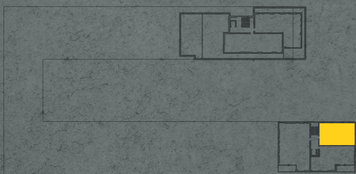
umístění bytu na 7. np