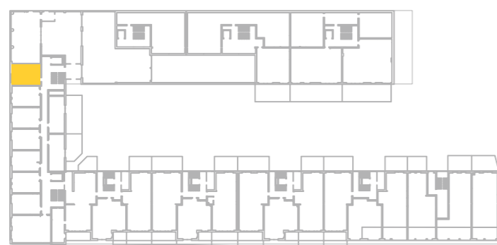
umístění bytu na 1. pp