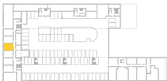
umístění bytu na 2. pp