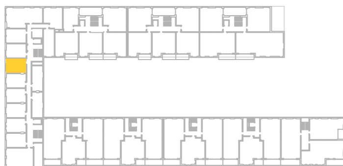
umístění bytu na 2. np