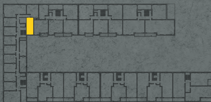
umístění bytu na 2. np