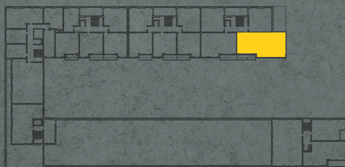
umístění bytu na 3. np