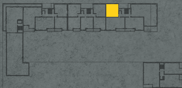
umístění bytu na 4. np