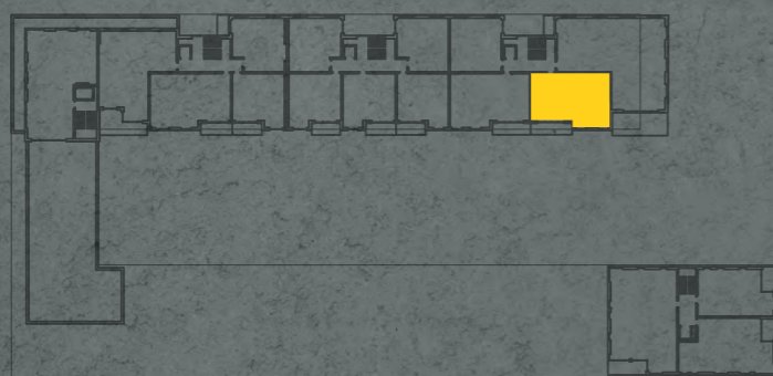
umístění bytu na 4. np