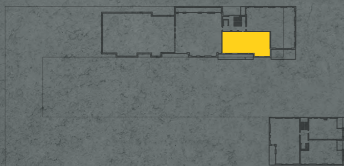
umístění bytu na 6. np