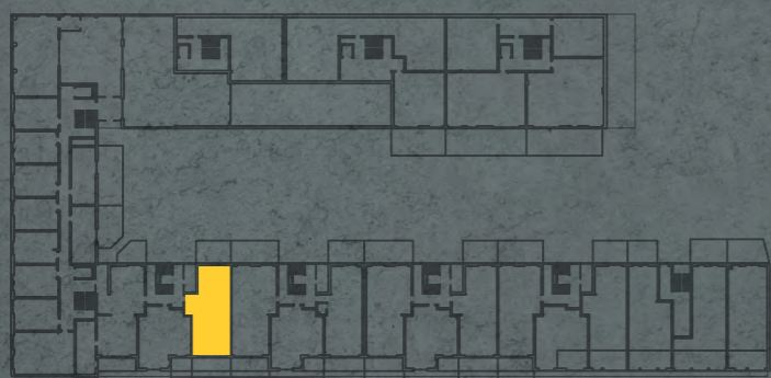
umístění bytu na 1. pp