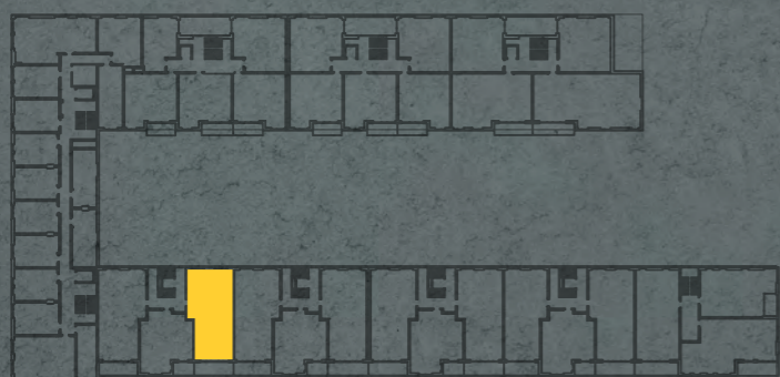
umístění bytu na 2. np