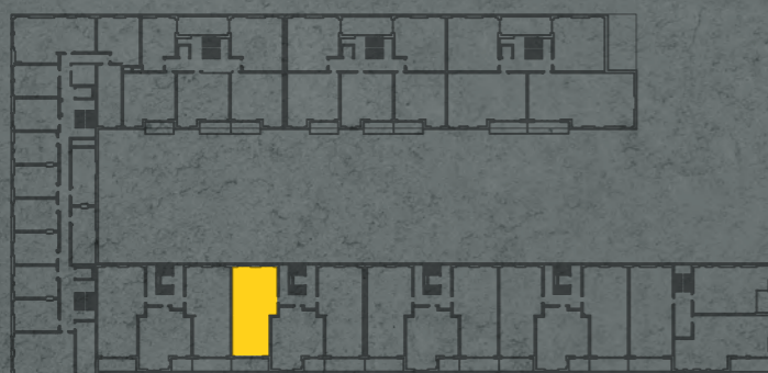
umístění bytu na 2. np