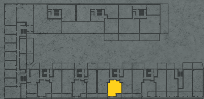
umístění bytu na 1. pp