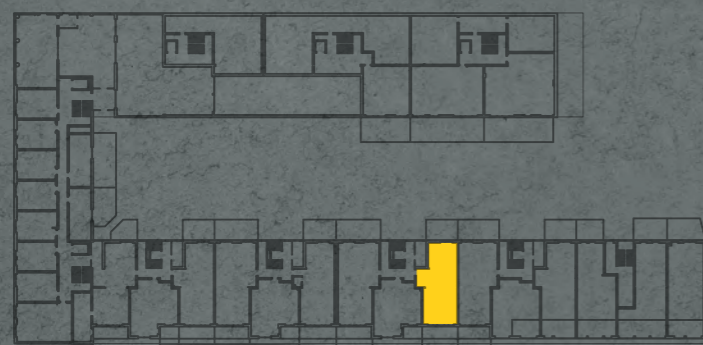
umístění bytu na 1. pp