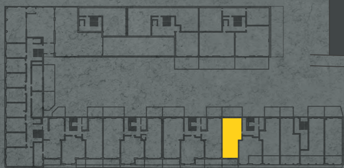
umístění bytu na 1. pp