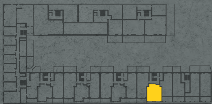
umístění bytu na 1. pp