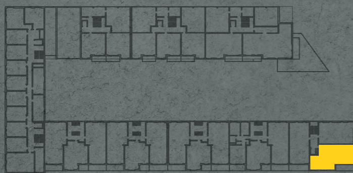
umístění bytu na 1. np