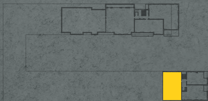
umístění bytu na 6. np