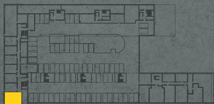
umístění bytu na 2. pp